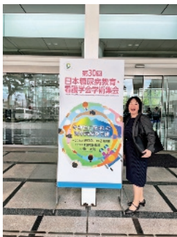
写真2 研究成果を学会で発表