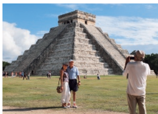
写真1. チチェン・イツァのピラミッド

「マヤ文明」というとどんなイメージをお持ちだろうか？ 実は考古学や文化人類学の研究の進展が新たな知見を提供している一方で、相変わらず「謎」や「神秘」という言葉で語られるようなイメージがつきまとっているのが「マヤ文明」なのだ(写真1)。こうしたイメージは主に観光客となる外部の人間、あるいは観光地との間を仲介するメディアや観光業界の側