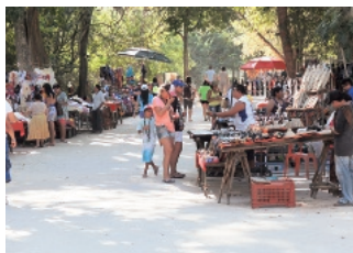
写真3. 遺跡公園内で不法に商売する地元の人たち