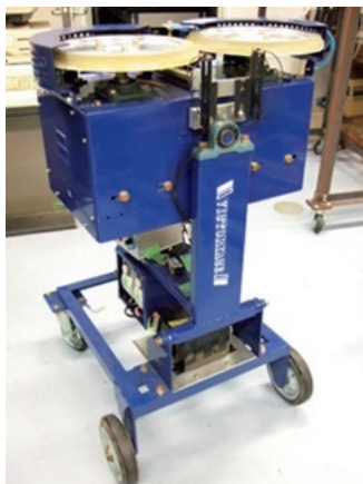
図3. バドミントン用シャトル発射マシン