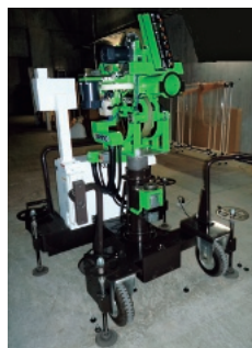
図1. 野球用四ローラー式ピッチングマシン

野球、バドミントン、卓球等のスポーツ用投球機や発射機の多機能化・高性能化の研究を行っている。図1は、人工知能(AI)を搭載した野球用四ローラー式ピッチングマシンである。本マシンの投球性能は、最高速度160km/h、直球はもちろんカーブ、スライダー、フォーク、さらにジャイロボール(図2)等のすべての球種を投球可能で、コントロールは希望するコースにボール2個未満の高精度で投げ分けことができ、プロ野球の一流投手を超える高い投球能力を持つ。