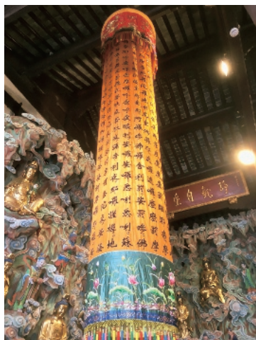
上海龍華寺の仏堂内。経幢に漢字音訳された陀羅尼(サンスクリット語の呪文)が書かれている。

今後は唐代以前、すなわち後漢～南北朝期の音韻史についても、引き続き漢訳仏典の音訳漢字を活用して解明していきたいと思っています。この方面での研究に進展が見られれば、この時期の中国およびその周辺地域で成立した漢字資料の音声的側面がより詳しく分かるようになり、それによって東洋史学や仏教学をはじめとする関係諸分野の文献学的研究にも寄与できると考えます。