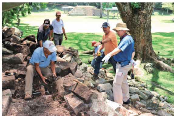
ホンジュラスの世界遺産「コパンのマヤ遺跡」7号神殿の発掘調査を指揮

文化資源学的研究は、JICA や文化庁とも連携し、世界複合遺産という文化 資源・自然資源を活用して、どのようにして自分たちの生活向上につな げていくか、コミュニティ住民や地元行政、カウンターパート政府機関と 一緒にその方策を考え、導き出す研修活動をしたり、遺跡の調査や記録、 修復保存に必須な三次元計測の方法とそのデータの活用法を教える研 修事業を行ったりしています。