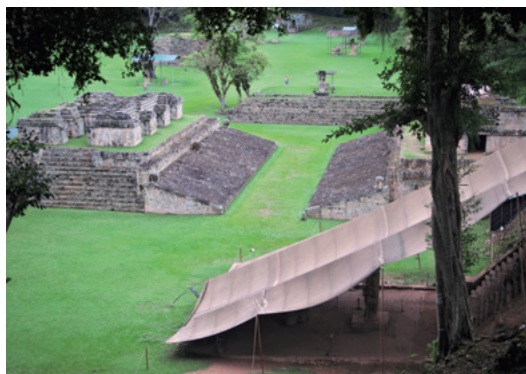
コパン遺跡 球技場

こうしたマヤ南東地域における地域間交流がマヤ文明の繁栄やマヤ南東地域の社会的・経済的発展にどのように寄与していったのかを明らかにしようとしています。その一環として、蛍光X線分析を用いた黒曜石の原産地同定やマヤ球技をはじめとする文化要素の比較を行っています。