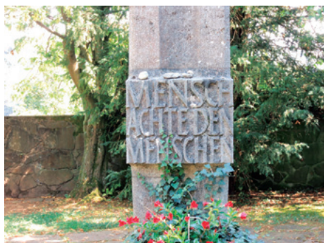
ハーダマル精神病院墓地の碑「人間よ！人間を尊重せよ」